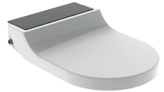
↑ Glas schwarz Art.-Nr. 146.270.SJ.1