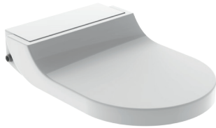
↑ weiß-alpin Art.-Nr. 146.270.11.1