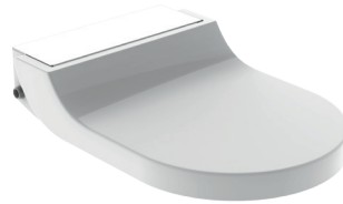
↑ Glas weiß Art.-Nr. 146.270.SI.1